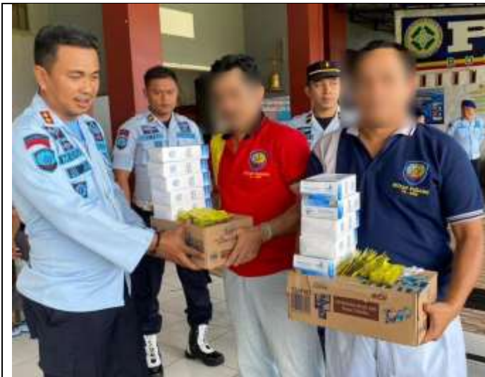
DETEKSI DINI DAN PENCEGAHAN PEREDARAN GELAP NARKOBA, RUTAN PADANG LAKSANAKAN TES URIN BAGI TAMPING