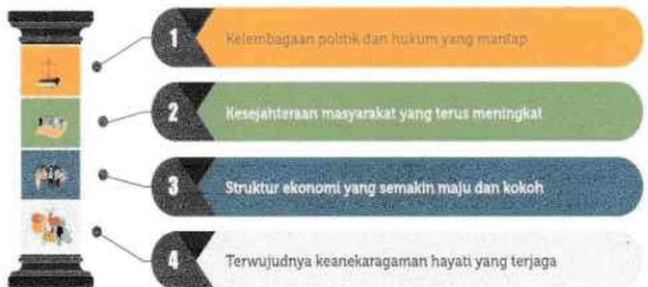
Gambar Empat Pilar RPJMN IV tahun 2020 - 2024

Rencana Pembangunan Jangka Menengah Nasional (RPJMN) 2020-2024 merupakan tahapan terakhir dari Rencana Pembangunan Jangka Panjang Nasional (RPJPN) 2005- 2025. Terdapat 4 (empat) pilar dari RPJMN 2020-2024 untuk mencapai tujuan utama dari rencana pembangunan nasional periode terakhir, yaitu: